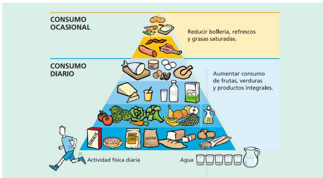
Pirámide de la alimentación saludable. SENC 2007.

¡Ojo! En condiciones normales, si no nos movemos, no necesitaríamos tantas. Intenta hacer ejercicio diario en un rincón de la casa.