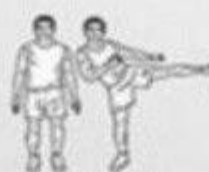
side leg raises