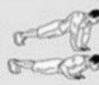
close grip push-ups